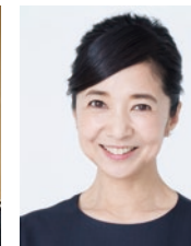
俳優 世界遺産検定1級合格 宮崎 美子氏